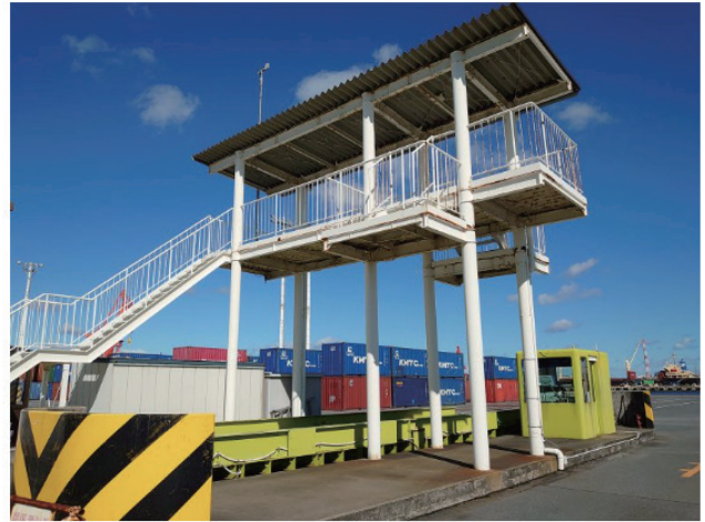
トラックスケール