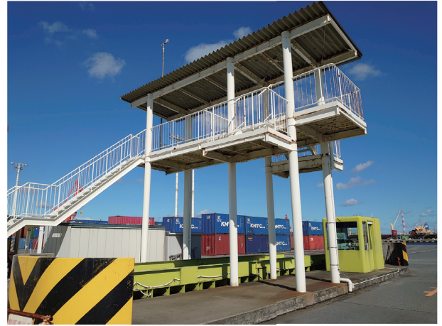
トラックスケール